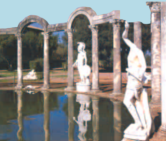
Villa Adriana bei Tivoli

Im Altertum bezeichnete man als Latium das Siedlungsgebiet der Latiner westlich des Apennin. 338 v. Chr. wurde das Gebiet von Rom unterworfen und ist seither kulturell durch das enge Verhältnis zur Metropole geprägt worden. Antike Städte und Villen, mittelalterliche Burgen und Dörfer, Renaissance-Paläste und Barockkirchen belegen hinlänglich die Bedeutung der Region in der Kunstgeschichte. Die landschaftliche Schönheit erkannten schon die Römer und erwählten das gebirgige Land zu ihrem Erholungsraum.