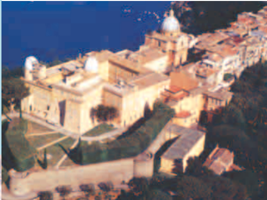
Castel Gandolfo: Die Sommerresidenz des Papstes