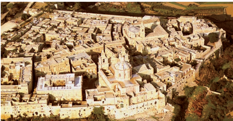
Blick auf die Altstadt von Mdina

Leitung: Michael Galea, Kulturgeschichte; u.a.