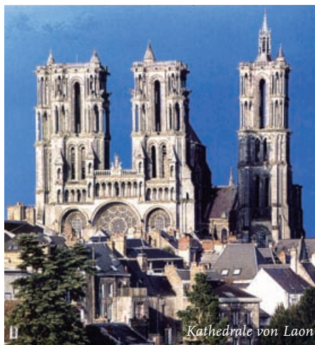
Kathedrale von Laon

Zuerst besuchen wir das bemerkenswerte Schloß von COMPIEGNE mit reichster Ausstattung aus der Zeit Ludwigs XVI. und Napoleon III. Die auf einem Berg thronende Kathedrale von LÄON mit den eingeschnittenen Portalen ist überwältigend, das älteste Krankenhaus Frankreichs aus dem 13. Jh. ist