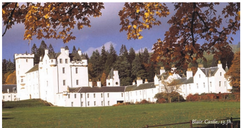
Blair Castle, 13. Jh.

Natureindrücke begleiten unsere heutige Fahrt in die Glencoe-Schlucht. In FORT WILLIAM, das im 17. Jh. von William of Orange erbaut wurde, besuchen wir das kleine West Highland Museum. Entlang der „Straße des Great Glen“, ein künstlicher Wasserweg von 96 km Länge, der die Nordsee mit der Irischen See verbindet, gelangen wir nach FORT AUGUSTUS am Südende des Loch Ness