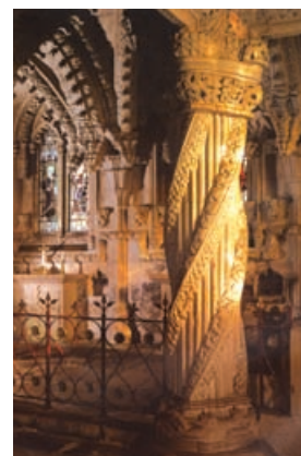
Rosslyn Chapel: Die Säule des Lehrlings

Im schottischen Grenzland erwartet Sie in