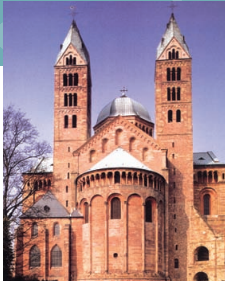
Der Dom zu Speyer

Leitung: Jens Friedrich, Geschichte; u.a.