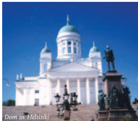
Dom in Helsinki

GÖTEBORG wurde 1619 durch König Gustav II. Adolf gegründet. Die schwedische Ostindische Kompanie verlegte ihren Hauptsitz 1731 dorthin. In der schwedischen Wirtschaftsmetropole sehen wir die Handelshäuser und Palais der Aristokratie, die öffentlichen Gebäude, die Plätze und großzügigen Boulevards. Das 1653 erbaute Kronhus (Zeughaus der Krone) besitzt mit dem Seefahrtsmuseum eine besondere Attraktion. Wir besuchen das Kunstmuseum mit der Spe-