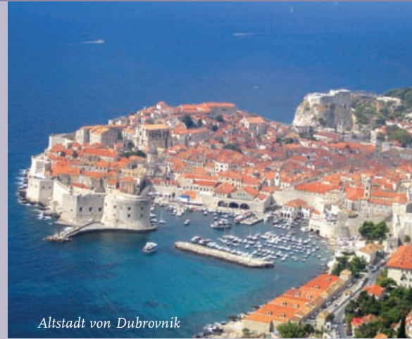
Altstadt von Dubrovnik

Das südslawische Volk der Kroaten vertrieb das asiatische Nomadenvolk der Awaren im 7. Jh. und mußte sich sodann den Byzantinern unterwerfen, ehe 925 ein erstes kroatisches Staatswesen entstand. Durch den florierenden Seehandel ab dem 11. Jh. wurde entsprechend repräsentativ gebaut. 1409 gelangte Venedig in den Besitz der dalmatinischen Küste und konnte seine Herrschaft als Handels- und Seemacht bis 1797 behaupten, bevor es nach der frz. Revolution bis 1920 an das österreichische Kaiserreich fiel. Die mittelalterliche Architektur ist eine Vermischung verschiedener Stile. Das stark gegliederte Küstenland wird durch das Dinarische Gebirge vom rauhen Hinterland getrennt.