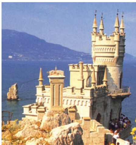
Das Schwalbennest auf der Insel Krim

Wir besuchen den Komplex um die herrliche Sophienkathedrale aus dem 11. Jh. mit den Sarkophagen der Kiewer Rus und Kosakenführer, das Goldene Tor als „Himmliches Jerusalem“, den vergoldeten Glockenturm, das Haus der Metropolen und das Konsistorium. Prächtigt das Höhlenkloster Petscherska Lawra aus dem 11. Jh., in deren Schreibstuben die älteste Chronik der slawischen Welt entstand. Sehenswert der berühmte „Skythenschatz“ und die mumifizierten Leichen der Mönche in den Katakomben.