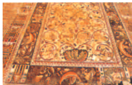
Mosaikboden aus der Omayyadenzeit

Kaiser Trajan das Reich der Nabatäer 106 n. Chr. annektierte. Wir sehen das Theater, die prunkvollen Fassaden von Ed-Deir, wandern durch die Fasara-Schlucht bis zum Zentrum der antiken Stadt und besichtigen die Fassaden der Felsgräber.