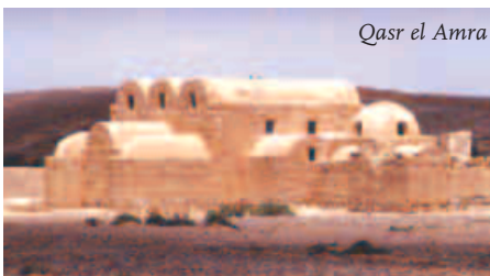
Qasr el Amra

Ein besonderer Höhepunkt ist die berühmte Mosaikkarte in der Georgskirche von MADABA. Über die „Königsstraße“ kommen wir zum Berg NEBO mit schönen Ausblicken. Abstecher zum TOTEN MEER. Weiterfahrt auf der „Königsstraße“ zur riesigen Kreuzfahrerfestung KERAK und Fahrt nach Petra. 300 km. Hotel Grandview****.