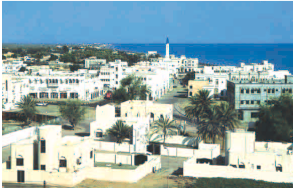
Blick auf Sohar

Herrlich ist der Blick vom GRAB DES PROPHE- TEN HIQB über die Hügel hinunter zur Weih-