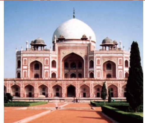
Dehli: Grabmal des Humayun

AGRA besitzt das berühmte Taj Mahal, die bedeutendste Bauschöpfung aus der Mogulzeit des Shah Jahans, geplant als Grabmal für seine Lieblingsfrau Mumtaz Mahal (Perle des Palastes). Eng in Beziehung zu diesem prächtigen Gebäude steht das Fort von Agra. Sie sehen in diesem Areal verschiedene Paläste und die Perlenmoschee aus Marmor. Das Grabmal Itmad ud Daulah aus der Mogulzeit, das die Kaiserin Nur Jahan in den Jahren 1622-1628 errichten ließ, besitzt an der Aussenfassade feine Pietradura-Arbeiten. Das berühmte Grabmal Akbars liegt in SIKANDRA . Der Bau wirkt durch die buddhistischen, hinduistischen und islamischen Elemente sehr ungewöhnlich. Hotel Jaypee Palace****.