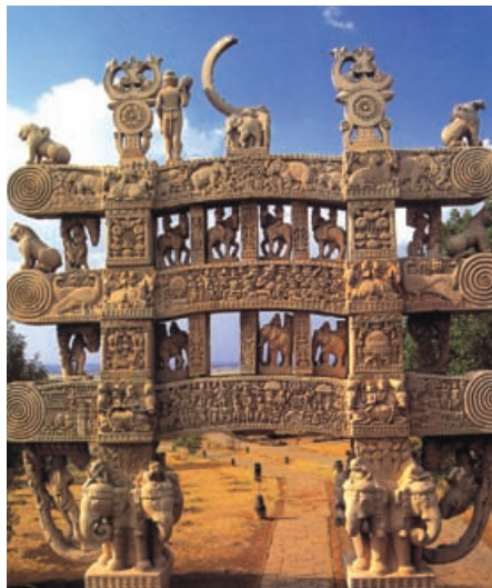
Tor zum großen Stupa von Sanchi

Busfahrt in die ehemalige Hauptstadt der Scinida-Dynastie, GWALIOR . Innerhalb der Festungsmauern liegen auf einem Felsplateau sechs Paläste, Hindutempel und ein Sikhtempel. Der Jai Vilas Palast verfügt über den größten Kronleuchter der Welt. Bahnfahrt I. Klasse nach Agra. Die verlassene Kaiserstadt FATEHPUR SIKRI aus dem 16. Jh. ist die imposanteste Hinterlassenschaft des Mogulreiches. Kaum fertiggestellt, wurde der Palast jedoch nie benützt infolge von Wassermangel. Kaiser Akbar verlegte den Regierungssitz nach Lahore in Pakistan und zog sich selbst nach Agra zurück. 80 km.