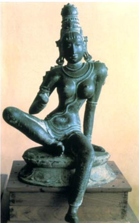
Bronzefigur aus der Chola-Zeit