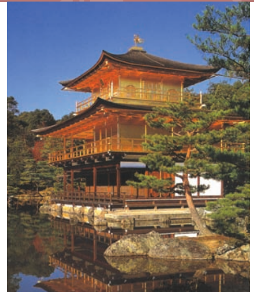
Kyoto: Der Kinkaku-ji Tempel

Heute besuchen wir in der Bucht von Hiroshima die Schrein-Insel MIYAJIMA , gewidmet den Töchtern der shintoistischen Windgottheit Susanoo. Die Gebäude sind in Pfahlbauweise über dem Wasserspiegel errichtet und bilden mit ihrem roten Balkenwerk und den weißen Wandflächen einen malerischen Anblick. Der Hauptschrein besteht gemäß shintoistischem Ritus aus mehreren Hallen. Die gewaltige Brücke von IWAKUNI wird Sie wie auch die phantastische Wasserlandschaft des INLAND-