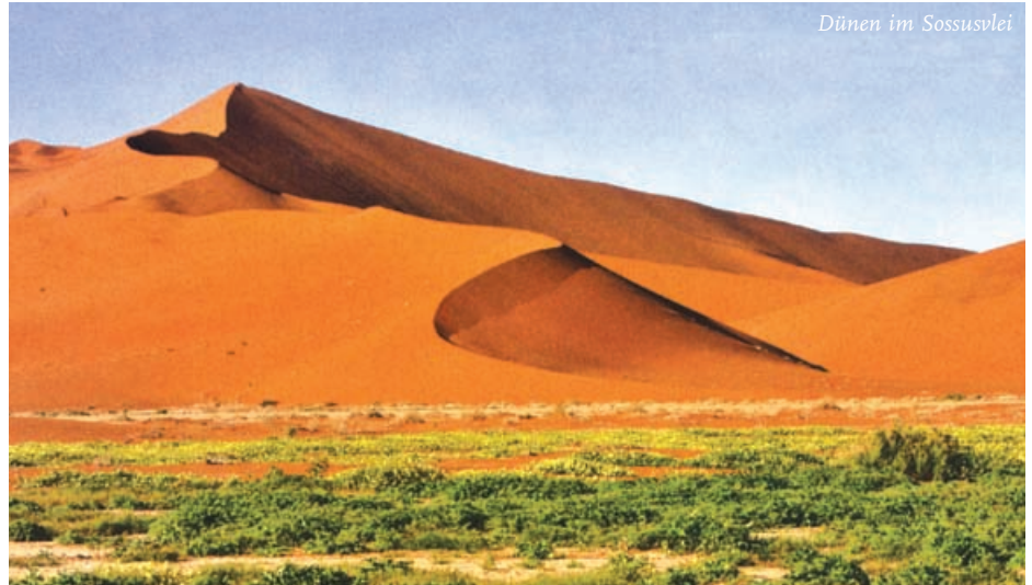
Dünen im Sossusvlei