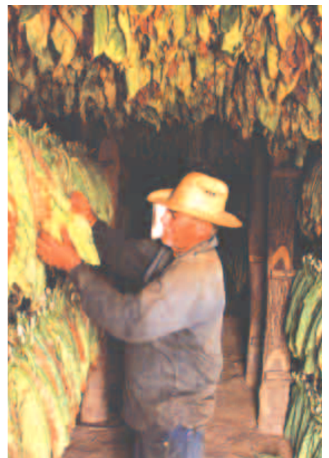
Tabakbauer in Vinales

In den Straßen PINAR DEL RIOS fallen besonders die klassizistischen Gebäude mit Säulengängen und -portalen auf. Inmitten des besten Tabakanbaugebietes besuchen wir einen Tabakbauern bzw. Tabakplantage. Das TAL VON VINALES ist wegen seiner bizarren Kalksteinhügel als Naturdenkmal geschützt. Mittagessen in PALENQUE, umge-