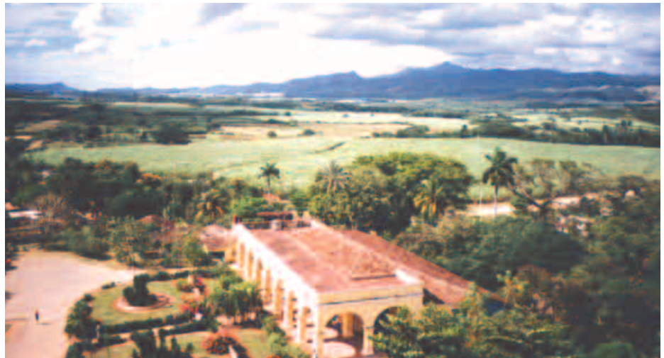
Valle de los Ingenios

Im Nationalpark GRAN PIEDRA ist die Vielfalt der Pflanzen interessant und der überwältigende Rundblick. Im Nationalpark BACONAO interessieren uns die Hühnerfarm als Versteck Castros vor dem Revolutionssturm und das prähistorische Tal mit Kopien von Dinosauriern, Mammuts und Steinzeitmenschen und die stille Lagune. Mittagessen auf der Insel CAYO GRANMA.