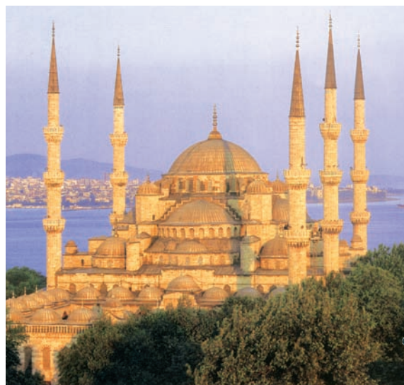
Die Blaue Moschee

schen Obelisken blieb über Jahrhunderte das Zentrum der Macht.