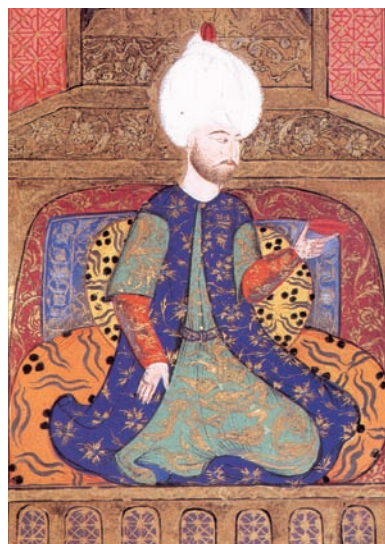
Istanbul: Sultan Suleiman der Prächtige

Faszinierende Metropole – Kulturhauptstadt Europas 2010