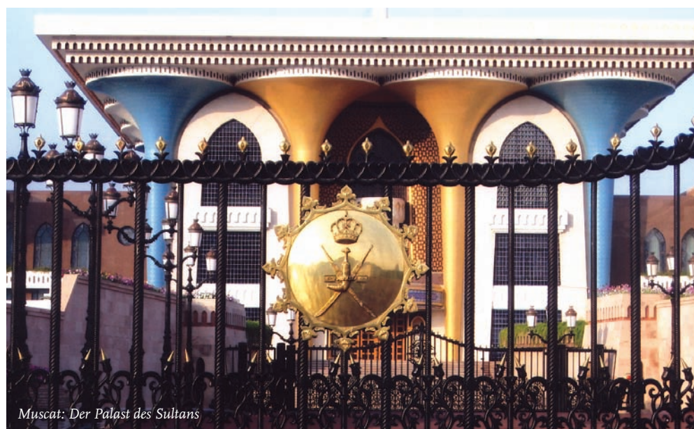
Muscat: Der Palast des Sultans